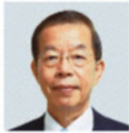
台北駐日経済文化代表処

1月13日、台湾で総統選が実施され、台湾の民主主義の成果が再び世界に示された。総統選の大規模集会では多くの人々が盛り上がる一方、有権者は投票日に静かに並んで投票し、結果が分かると与野党の候補者が健闘をたたえあった。台湾の政党政治は日米欧の各国に比べると日が浅いとはいえ、民主主義の秩序が育ったことは台湾の成長を示すものである。